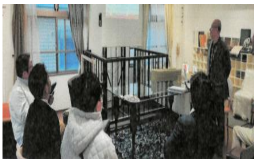
椅子張り技能士会研修会

東技連に加入することで異業種の方と知り合う機会が増えました。工場見学等視察事業や異業種交流会でいろいろな職種の方と話をすると視点が変わり、視野が広がりとても勉強になります。匠の技の祭典で異業種コラボ !! なんてことも実現したりして...。多くの出会いに感謝しております。