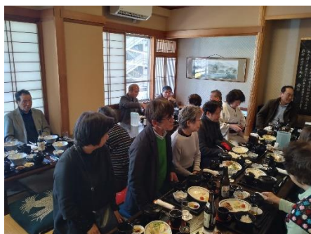
異業種交流懇親会

東技連の青壮年部のメンバーとして活動させて頂いて、数年経ちます。他の職種の方と触れ合う機会というのは、東技連に入るまでありませんでした。技能士会の運営、活動内容、技能試験等多くのことを相談できたりする場ができたことが私にとっては大きな勉強になっています。