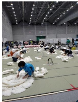
左：「ものづくり匠の 技の祭典」2023 右：技能グランプリ 2023